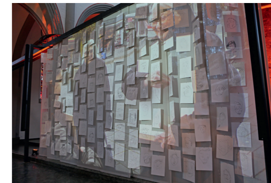
Augenblickmal – Ausstellung in der Citykirche, Hans Jonas Symposium, 19.01.2018

MGconnect, Industriepartner (SMS group, geoban, RAEDER) und die Hochschule Niederrhein, Agentur für Arbeit, Katholische und Evangelische Kirche, Hans-Jonas-Gesellschaft MG, Lions Club MG, Kulturstadt und Stadtbibliothek, Schützenbruderschaften und Sportvereine Johanniter MG Jugendcafe Neuwert Stiftung „Lesen“